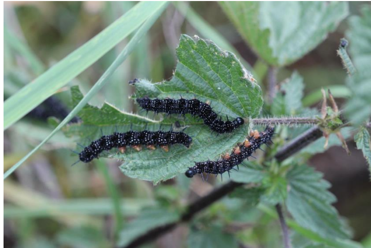
Rupsen van de Dagpauwoog