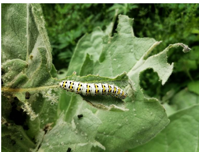
Rups van de Kuifvlinder

In het kader van het 50 jarig bestaan van KNNV afdeling Lelystad is het bestuur allerlei extra activiteiten aan het uitbroeden. Onder meer wordt gewerkt aan een speciale uitgave van het Lokvogeltje. Houdt dit jaar de agenda goed in de gaten.